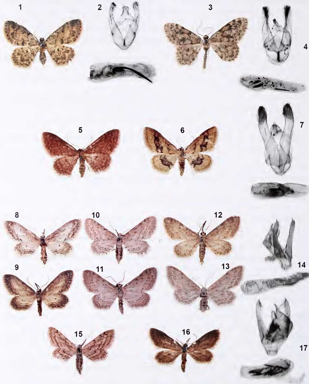
Lámina I.- 1. I. vilaflorensis (♀) S. Bartolomé, GC, I-1966; 2. Andropigio de I. vilaflorensis ; 3. I. unicalcarata (♂) Haría, LZ, IV-1972; 4. Andropigio de I. unicalcarata ; 5. I. charitata (♀) Bco. de Ruiz, TF, V-1968; 6. I. charitata f. adaversata (♂) S. Bartolomé, GC, VI-1966; 7. Andropigio de I. charitata ; 8. I. longaria (♂) Las Mercedes, TF, IV-1970; 9. I. longaria (♀) Las Mercedes, TF, XII-1970; 10. I. longaria (♀) La Matilla, FU, VI-72; 11. I. longaria (♂) La Matilla, FU, VI-72; 12. I. longaria (♂) Haría, LZ, VI-1972; 13. I. longaria (♀) Haría, LZ, V-1972; 14. Andropigio de I. longaria ; 15. I. abnormalis (♀) Caldera de Bandama, GC, V-1967; 16. I. abnormalis (♂) Caldera de Bandama, GC, VI-1967; 17. Andropigio de I. abnormalis .